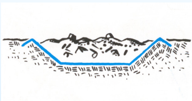
Bottentätning av t.ex. deponier.