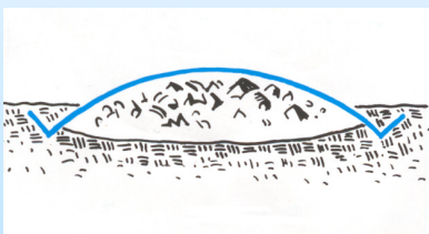
Topptäckning av deponier och inkapsling förorenade markområden.