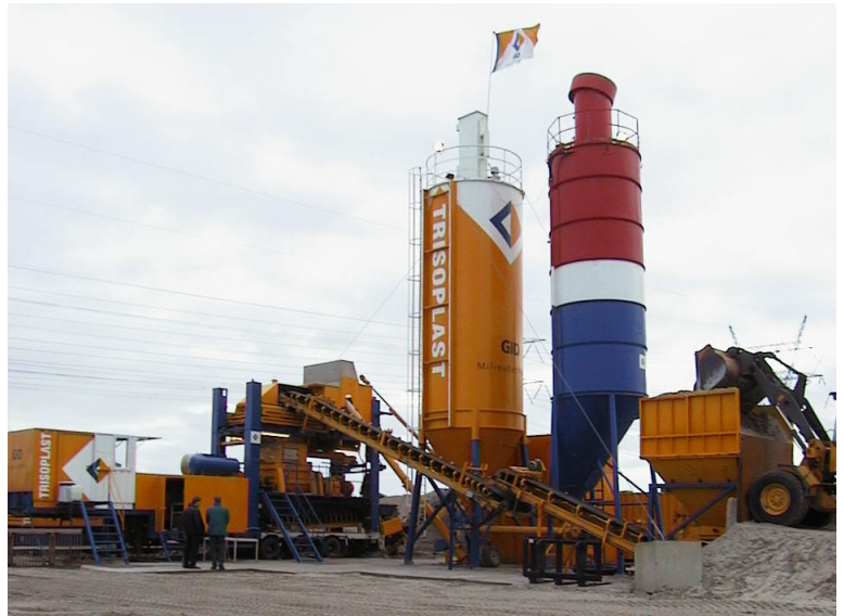
Anläggning för automatisk blandning av Trisoplasts tre komponenter: filler, bentonit och polymer.

BAT Cofra AB Box 1060 186 26 VALLENTUNA Tfn: 08-511 70600 Fax: 08-511 73361 www.batcofra.se