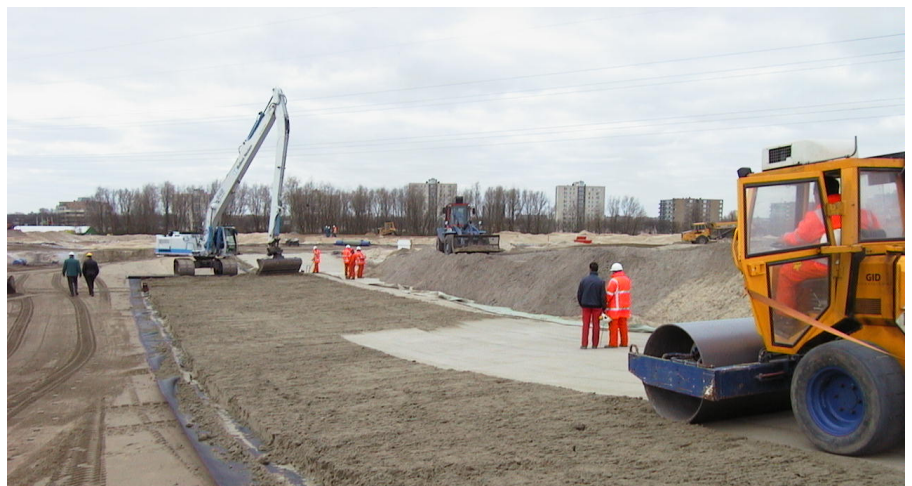
Färdigblandad Trisoplast läggs ut med grävmaskin varpå det kompakteras med vält eller vibratorplatta.

Trisoplast är motståndskraftigt mot syror och baser, råolja, fenol, diesel, lakvatten från deponier och havsvatten.